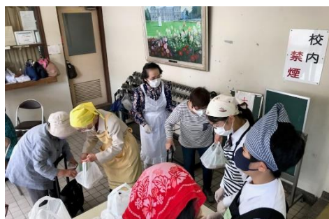
笹塚なかよし食事会