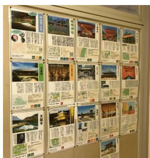
修学旅行事前学習