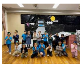
12月 チャレンジランド