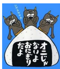
「オニじゃぬはおにぎりだよ」