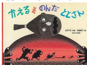
「かえるをのんだととさん」