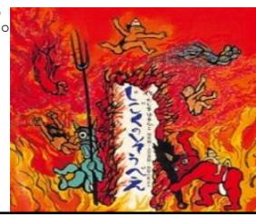
「じごくのそうへい」