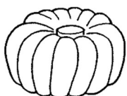
かぼちゃ (なんきん)