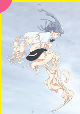
キャラクタープラン