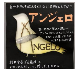
読書コンクール 生徒作品