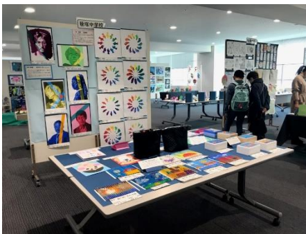
小中合同展覧会に出品しました。