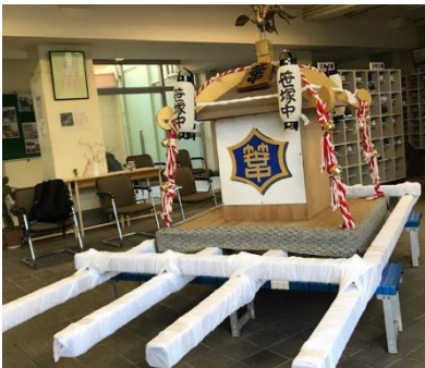
今年度も十五祭の時期になりました。