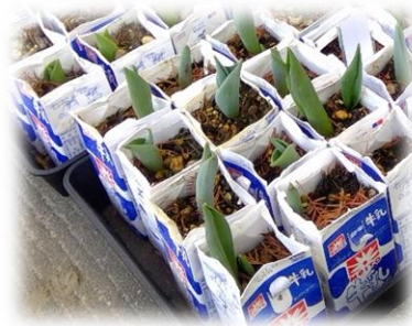
春は、すぐそこに（チューリップの芽）