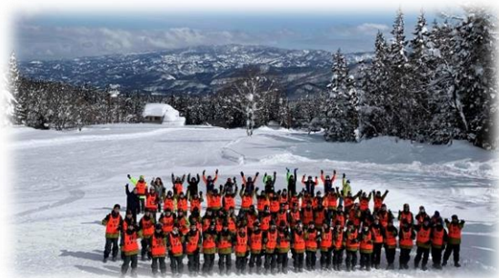
晴天に恵まれたスキー教室