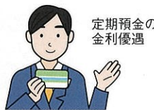
定期預金の金利優遇