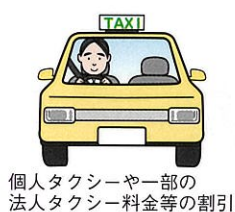
個人タクシーや一部の法人タクシー料金等の割引

自動車の運転をやめられた高齢者のみなさまに対する生活サポートの趣旨に賛同した企業、店舗、文化施設等において、様々な特典が受けられます。運転経歴証明書の交付を受けた年齢65歳以上の方は、お持ちの運転経歴証明書により、東京都の「高齢者運転免許自主返納サポート協議会」の加盟店や一部の美術館等で各種優待を受けることができます。