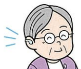
メガネ・補聴器等購入割引