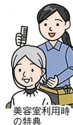
美容室利用時の特典