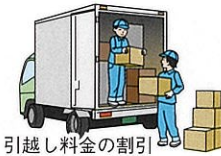
引越し料金の割引