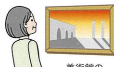
美術館の入館料割引等