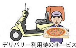
デリバリー利用時のサービス