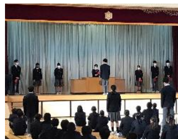
後期生徒会認証式

11月9日に後期生徒会の認証式が開催されました。前生徒会長ならびに前期専門委員長の3年生から、新しく組織された生徒会役員と専門委員長に引き継ぎが行われ、認証書が手渡されました。