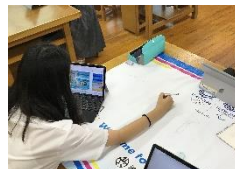
(左)卒業生の活躍:東京大会優勝 (中)3年生租税教室 (右)オリパラ スクールドレッシング