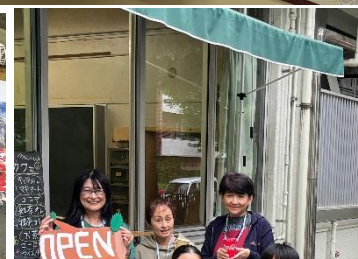
地域スタッフの皆さん