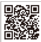
日本高血圧学会 減塩食品リスト

日本は長寿国ですが、健康寿命は平均寿命より10年ほど短く、その最大の要因は脳卒中や心臓病です。減塩はそうした病気にかからないようにするための大きな手立てになります。