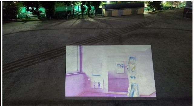
昨年度 大型(高輝度)プロジェクターを導入 校庭に クッキリ! そして 大きく! 投影することができます