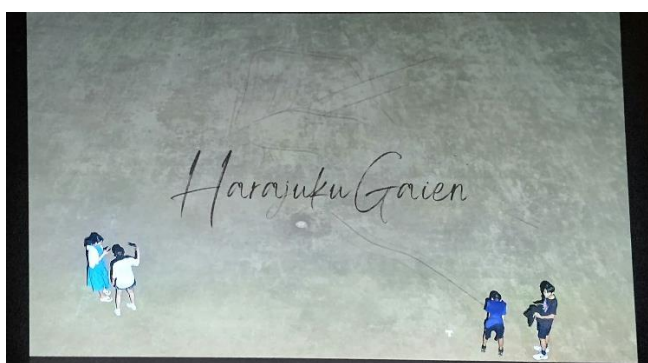
校庭プロジェクションマッピングもやってみました！