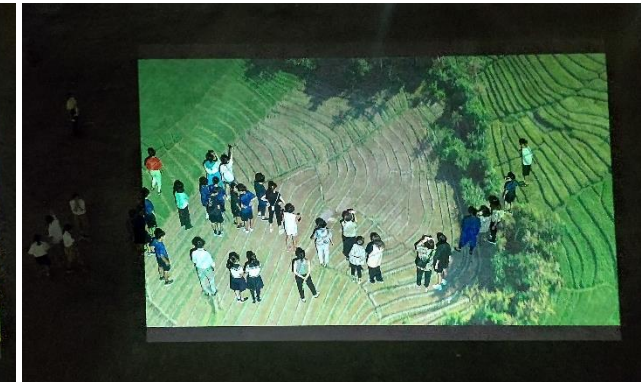
「team LAB」さんのように映像の中に没入! 「team HaraGai LAB」にも挑戦!