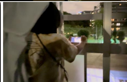
参観者は自分の観たい場所からアプローチ