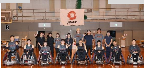
チーム「Freedom」←日本代表の池キャプテンが所属しているチームです！