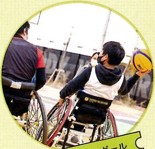
車いすバスケットボール