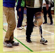
義足体験 (パラ陸上)