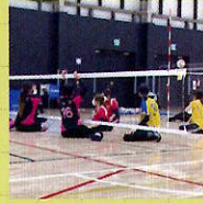
シットイング バレーボール