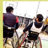
車いすバスケット ボール 体験時間 30分/回 10:30から30分刻み 最終開始時刻15:30 定員 10人/回 全11回実施

体験内容とスペースの都合上、体験1回あたりの時間と定員があらかじめ設定されています。事前の予約をお勧めします。キャンセルが発生した場合や実施時間帯によって、定員に空きがある場合は、当日会場で体験お申込みできます。 定員になり次第、受付終了となります。あらかじめご了承ください。