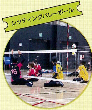
シッティングバレーボール