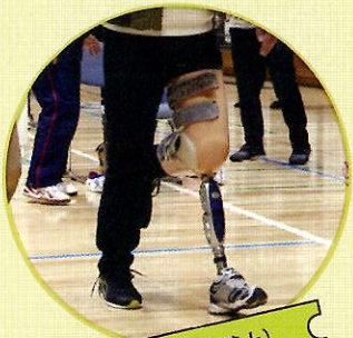
義足体験 (パラ陸上)