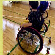
パラバドミントン