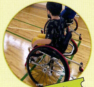
パラバドミントン