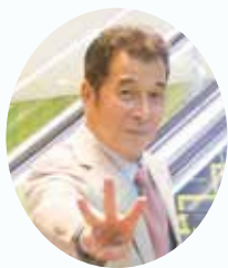
第45回渋谷区くみんの広場実行委員会 実行委員長