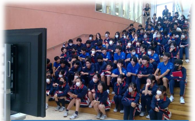
安諸先生チョイスのベストフォトに和み・・・

今週1日(月)の6校時、ベストフォトコンテストの概要説明を受けて、行動班ごとに、修学旅行先で撮ったベストフォトを5部門に分けてスライドで発表しました。準備時間の少ない中、その場所でのエピソードやハプニングを面白く話したり、クイズを出したりと、各班の工夫を凝らした発表が見られました。聞き手の反応をうかがいながら、原稿を見ないで堂々と語れる人が増えてきたのも、各クラスの温かい雰囲気作りや授業での協働活動が活きていると思います！さあ、来週は学年での代表班発表です。楽しみですね(^-^)