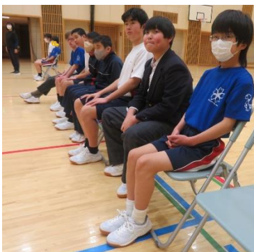
5年ぶりに全生徒参加の卒業式本番！