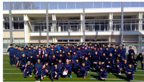
↑覚えているかな？最後みんなで撮りますよ！