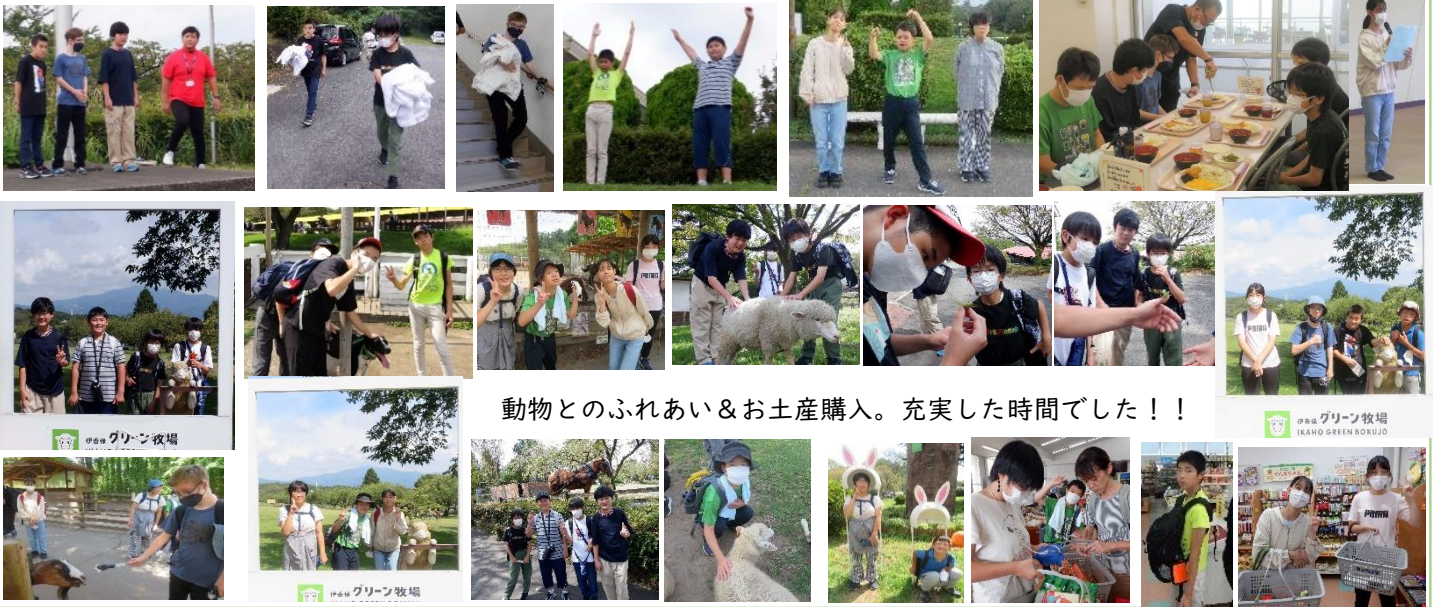
動物とのふれあい&お土産購入。充実した時間でした！！