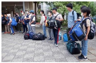
れんごうあかぎどうきょうしつ 連合赤城移動教室

先週の12日(火)から15日(木)までの3日間、連合赤城移動教室に行ってきました。群馬県の「国立赤城青少年交流の家」に宿泊し、野外炊事(カレー作り)や地蔵岳/小沼・覚満淵ハイキング、伊香保グリーン牧場でのシープドッグショー見学といった体験をしてきました。宿舎内では、他校との色々なレクでの交流や、食事のバイキング、大きなお風呂も楽しかった！2,3年生は去年に引き続き2回目の連合宿泊でした。誰もが期待と緊張でドキドキしていましたが、あっという間の3日間で、みんな元気に赤城の自然や他校の友達との交流を楽しみました。今週号では、3日間の旅の様子を写真でたっぷりご紹介いたします！