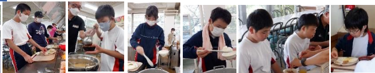
朝のつどい⇒朝食。おなかペコペコで、皆しっかり食べました。