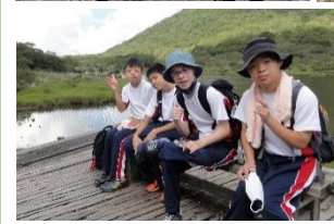
素敵な景色を みながら、一生 懸命に歩きました。最後は一 緒に昼食♪