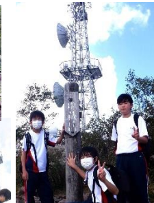
じぞうだけしょうじょう 地蔵岳頂上