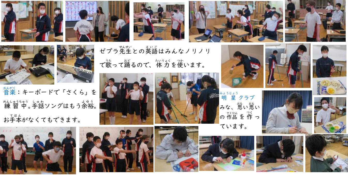
ゼブラ先生との英語はみんなノリノリ で歌って踊るので、体力を使います。