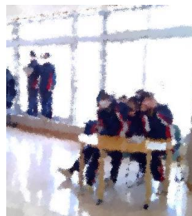
昼休み友達とお喋り