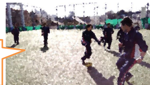
昼休みのサッカー (彼らは山盛りのカレーを食べた直後なのに走っている…すごい)