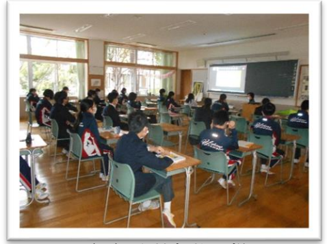
<14日（月）全校朝礼の様子>