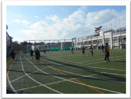
<28日昼休み。校庭にたくさん出ています>