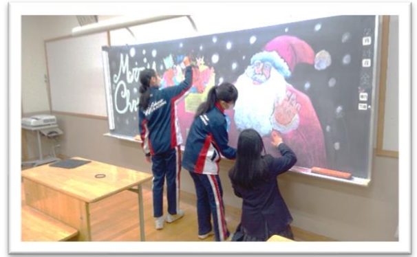
<黒板アート。明日はクリスマス>