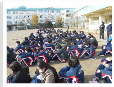
<いよいよ始まります>