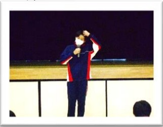
<保健給食 KI くん>