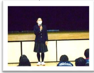
<学級 FM さん>