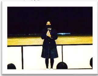
<放送 TS さん>