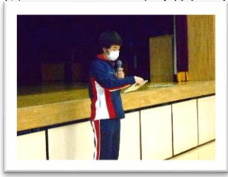
<2組 AS くん>