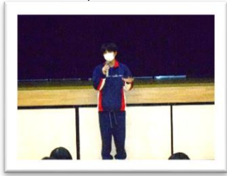
<風紀 UH くん>