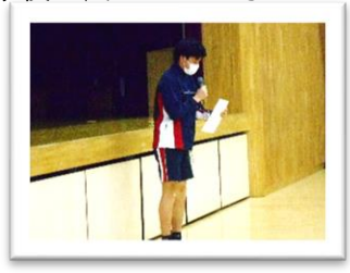
<明星 GK くん>