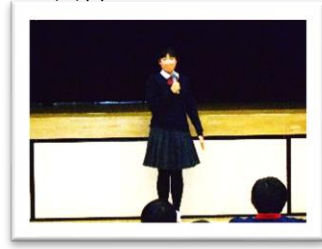
<学習発表会 SA さん>