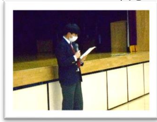
<3組 FK くん>