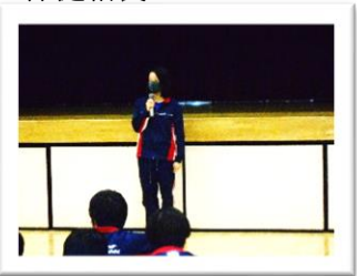
<年輪編集 KM さん>