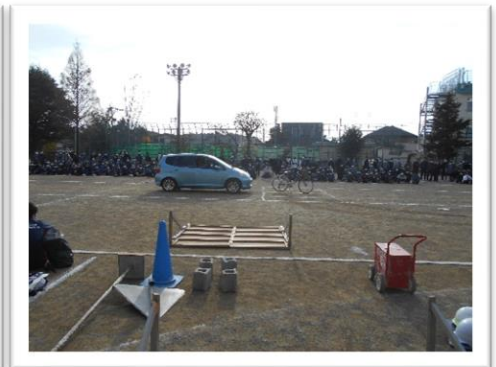
<乗用車と自転車の接触！危険です>