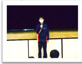
<図書 KY くん>