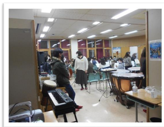
<昨日夜のWSOの練習の風景。これからが楽しみです♪>