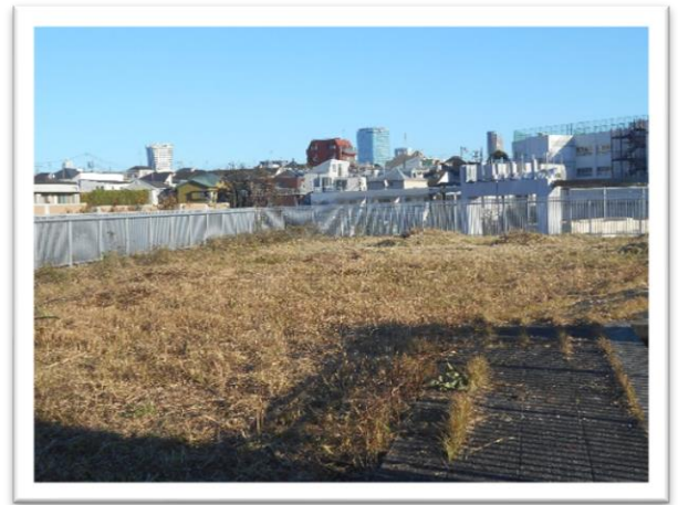
<11月25日(木)屋上から創立100周年の上原小学校を撮影しました>