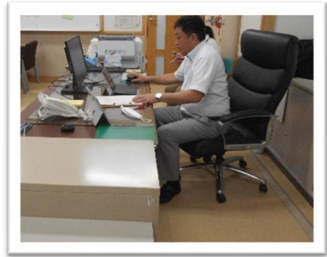
<6日（月）オンライン全校集会。校長室の様子>