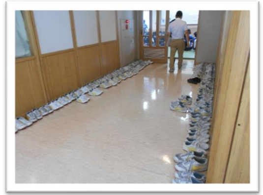
<6月21日（月）学年朝礼前の柔道場前。クラスごとに靴をそろえています>