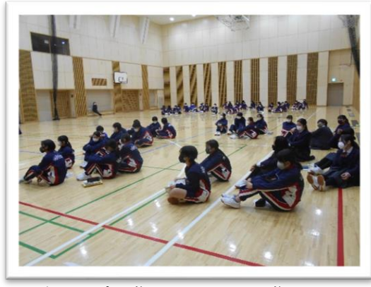
<グループに分かれてチーム分け>