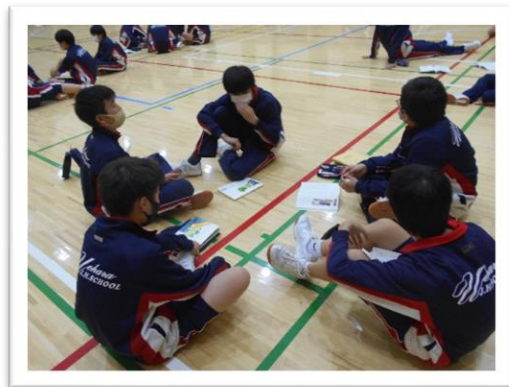
<チーム内で演じます>