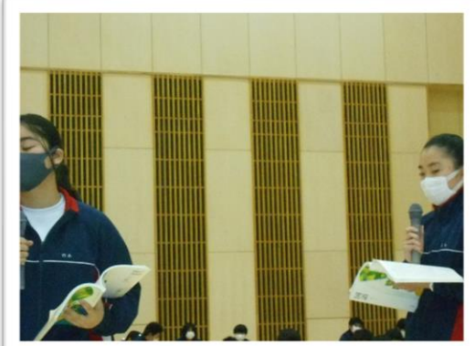
<女優二人の演技。迫真に迫る！>