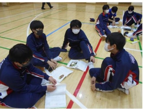
<チーム内の演技はなかなか大変・・・>