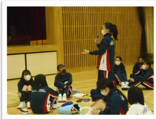
<意見はそれぞれ違います>