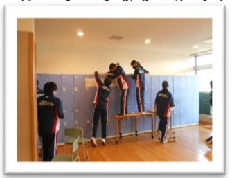
<ロッカーの上は結構大変!!>