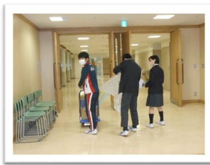
<使った道具は職員室・事務室へ>