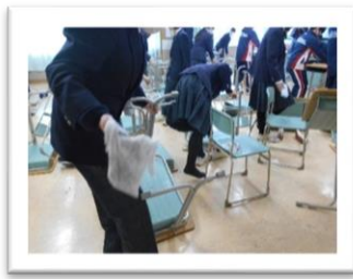
<椅子の足を拭いています>