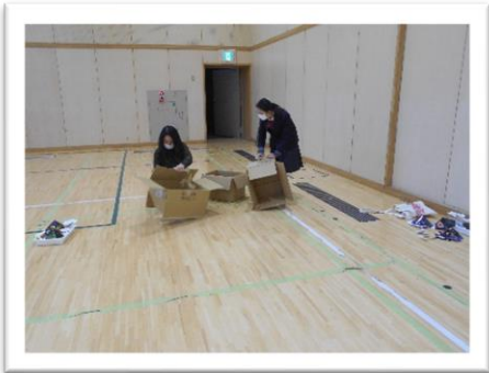
<段ボールの解体です>