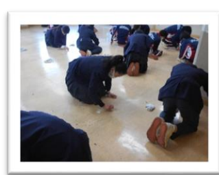
<床を消しゴムで消しています>