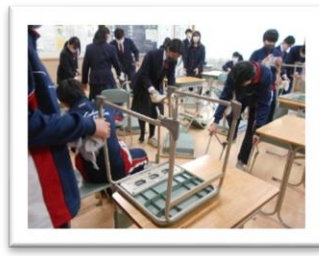
<結構埃があります>