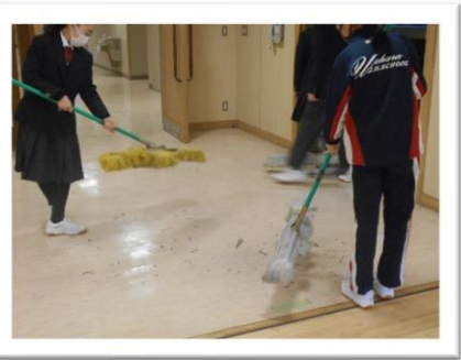
<結構埃が出てきました>

今年度は日本文化部の生花がありました。今までの展示会には無かった趣きを出してくれました。生花なので一足先の片付けでしたが、部員の片付けも手際よくやってくれたので気持ちよい余韻に包まれました。