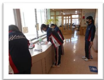
<結構雑巾が汚れました>