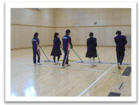
<最後にモップをかけます>