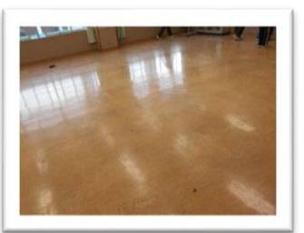
<床が素敵に光っています～>