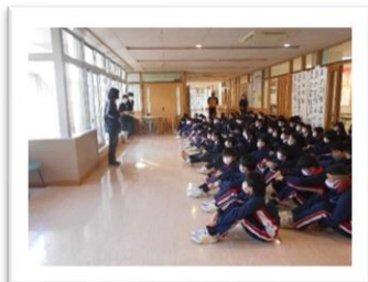
<森本先生よりガイダンス>

各教室、机を出して床を中心にきれいにしました。掃除が進むと、教室の中で気になっているところがたくさん出てきたようで、結構隅々まで清掃していました。みんな一生懸命取り組んでいました。