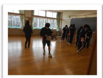
<床にはいろいろなものがあります>