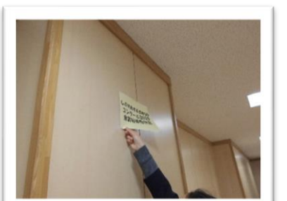
<取り残しに気づいた!>