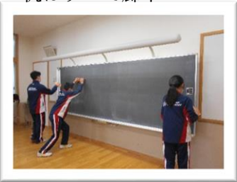
<黒板を美しくしています>