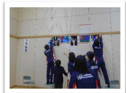
<絵画は高いところにあり、取るのが大変です。どの学年も苦戦しています>