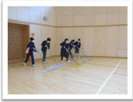
<みんなの調子をあわせて1・2・3>