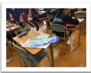
<片付け終わって、展示作品の返却です>