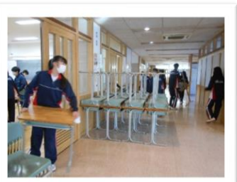
<机はすべて廊下へ>