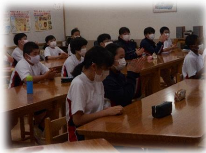
<委員会の立候補ありました！>