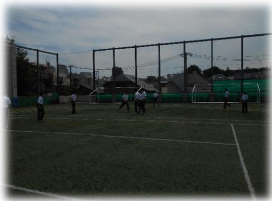
<3年生と一緒にサッカーをやっています！>