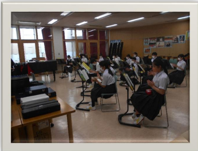
<手拍子でリズムをとって！>