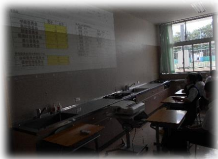
<委員会の一覧を見えています。>