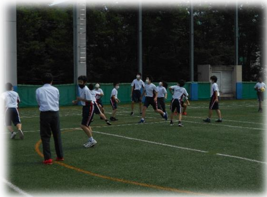
<バレーボールが始まりました～>