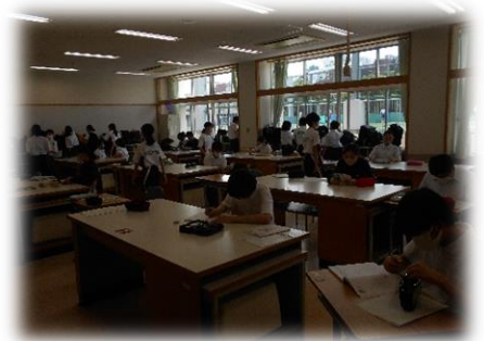
<さあ係の仕事開始です。>