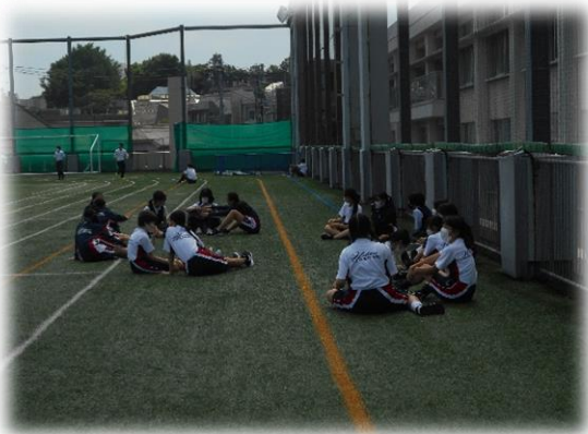
<輪になって日向ぼっこ？>

今日の昼休みの風景です。梅雨の合間の貴重な晴れになりました。金曜日と同じように給食後、校庭に出ています。暑い昼下がりでしたが、元気に走り回っている姿が見られました。