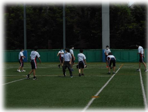
<元気に走り回っています。>