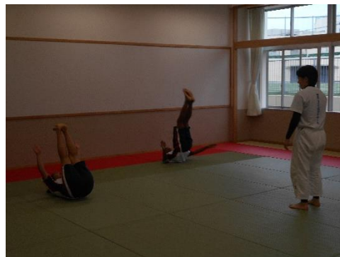
<柔道部の仮入部におじゃましました。後ろ受け身の練習を頑張っていました。>

10日(水)より始まった各部活動の仮入部。毎日いろいろな部活動に参加しています。「今日はどの部活動に行こうかな？」休み時間に話している人がいました。正式入部の前には必ず一度は仮入部をしてください。そして1年間(できれば3年間)続ける気持ちが決まったら、正式に入部届を出してください。