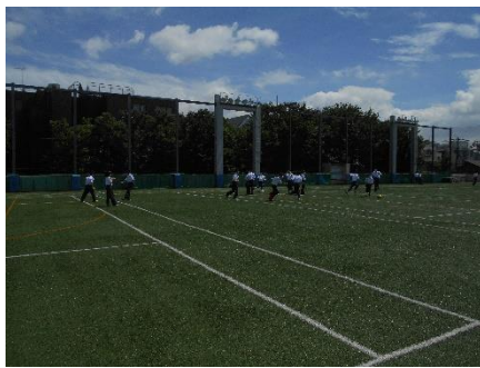
<サッカーが始まりました！>