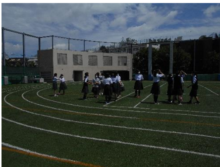
<校庭にたくさん出ています。>

サッカーをしている人、鬼ごっこをしている人、わいわいやっている人、いろいろなことをやっていましたが、とても楽しそうでした。登校開始以来、このようにみんなで集まって何かをすることがありませんでした。体を動かしたので、昼休み明けは、疲れた感じでしたがとてもよい表情でした。