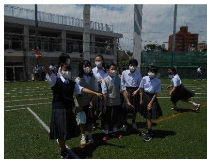
<なんだか楽しそう～>