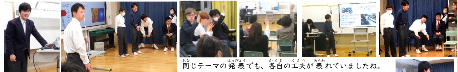
同じテーマの発表でも、各自の工夫が表れていましたね。