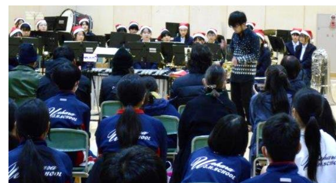
吹奏楽部クリスマスコンサートの様子

3年生はいよいよ受験本番となります。毎日の努力が必ず実を結び信じています。自分を信じて、最後まで諦めずに頑張ってください。どんなに大変な時でも、あなたの努力は無駄にはなりません。夢に向かって一步一步進んでいきましょう！応援しています！