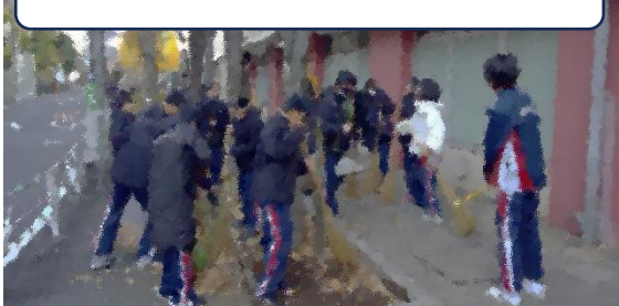
初日から多くの生徒が参加