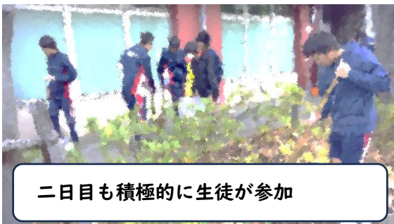
二日目も積極的に生徒が参加