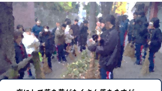
一夜にして落ち葉がたくさん落ちますが…。