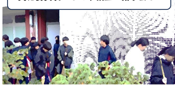
美化委員長として下級生に指示出し