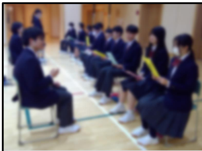
面接官役3人と受験生1人でローテーション!!

学年の面接練習は、小体育館を使って、 身だしなみの確認、入退室の動き、よく聞かれる質問に対する答えのキーワード作成 など、5時間分を使って進めてきました。4人1組になって、 面接官役として、しっかりと友達に適切なアドバイスをする姿 も増えてきました。いいことです!「面接官の目を見ると、言いたいことが抜けてしまいます。」「私の言っていること、つながり・・・おかしくなかったですか?」「環境問題って大きいテーマで答えたほうがいいですかね?」いろいろな声が飛び交っています。前向きに取り組む姿勢が嬉しいです!次週は練習を終えての感想を紹介します。