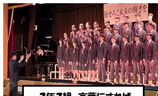
3年3組 言葉にすれば