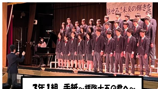
3年1組 手紙~拝啓十五の君へ~