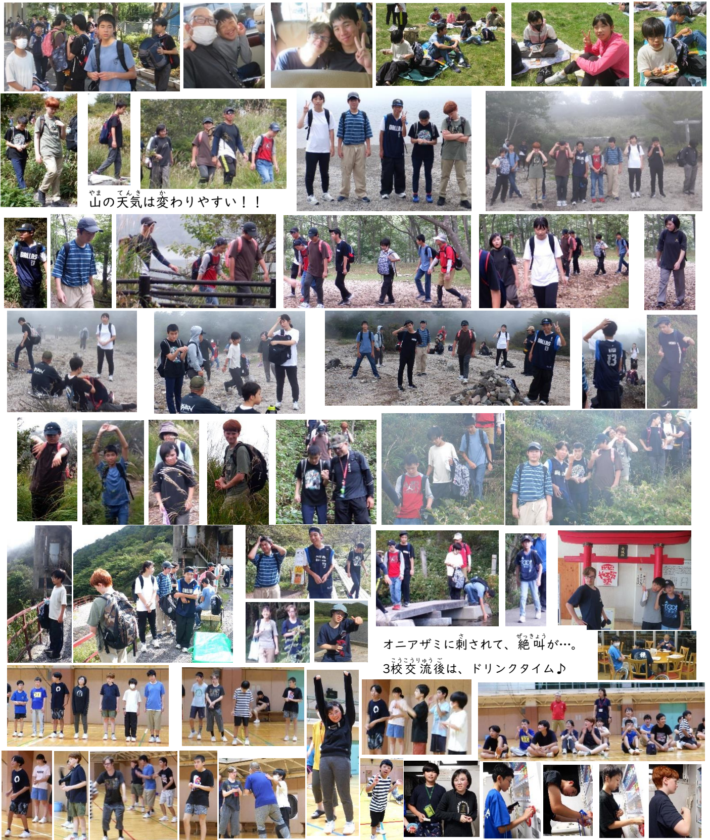
山の天気は変わりやすい！！