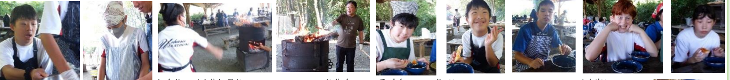
各自が係仕事にきっちりと取組み、手作りの美味しいピザ&ポトフが完成!