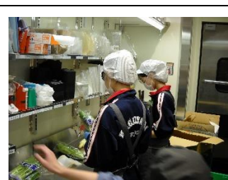
スーパーマーケット