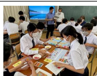
ボードゲームの様子

本年度鉢山中学校では、シブヤ未来科（総合的な学習の時間）として、SDGs 探究学習を行います。そのオープニングとして、SDGs 特別授業「SDGsを自分ゴト化するワークショップ～SDGsボードゲーム～」を行いました。これは、一般社団法人 未来技術推進協会が作成したボードゲームをしながら、SDGsに関する世界の課題解決事例を学んでいくワークショップです。同協会から3人のファシリテーターの方に来ていただき、講演も交えての3時間プログラムを実施しました。楽しみながら、SDGsについて学ぶことができ、最後は自分が最も気になるSDGsの課題について意見交換をしました。その課題が、これから一人一人が探究していく課題となります。また、この取組は地域学校協働本部と学校で計画した地域学校協働活動でもあります。保護者・地域の方と一緒に実施しました。