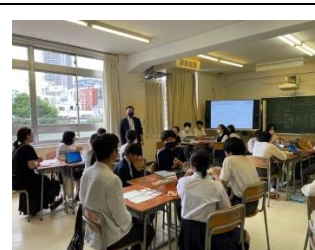
保護者・地域と共に