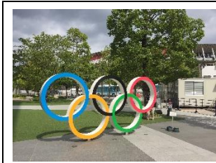
オリンピックマーク

当日は、曇り空で気温もそれほど高くなく、座席も4~5席間隔で座ることができ、安全に観戦を終えることができました。初めて入るオリンピックスタジアムで、世界レベルの大会を観戦することができて、(世界新記録も出ました。)有意義な観戦となりました。