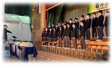
若木祭(舞台発表の部)