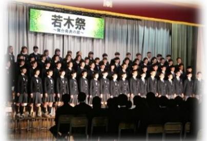
若木祭(舞台発表の部)