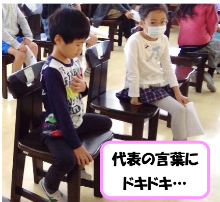
代表の言葉に ドキドキ…

当日は、校長室から学校長の挨拶や学校運営協議会委員長のお話、PTA会長からの記念品目録の贈呈を配信し、その後は家庭科室から計画委員と代表の子供たちによる会へと続きました。各教室からは歓声が時折聞こえ、代表の子供たちの控室となったランチルームでは会の終了後に拍手がわきました。その日は小春日和でしたが、校舎内も温かい雰囲気になりました。