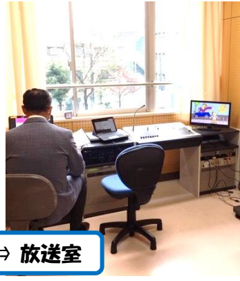
教室 ⇄ 放送室

代々木警察署のスクール・サポーターの協力を得て、「セーフティ教室」も開催されました。例年であれば体育館に集合して授業を受けますが、今年はTeamsによるオンライン授業となりました。スクール・サポーターの方は放送室から、各教室の子供たちに向けて話をしたり動画を流したりしました。