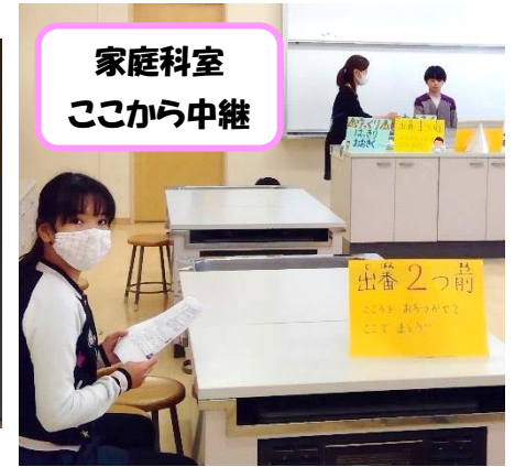
家庭科室 ここから中継