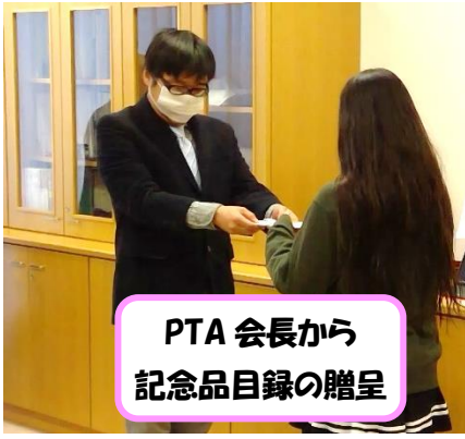
PTA 会長から 記念品目録の贈呈