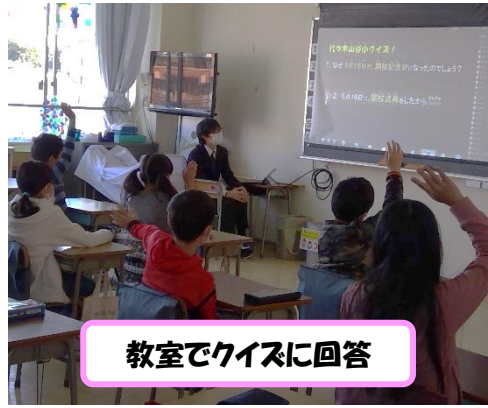
教室でクイズに回答