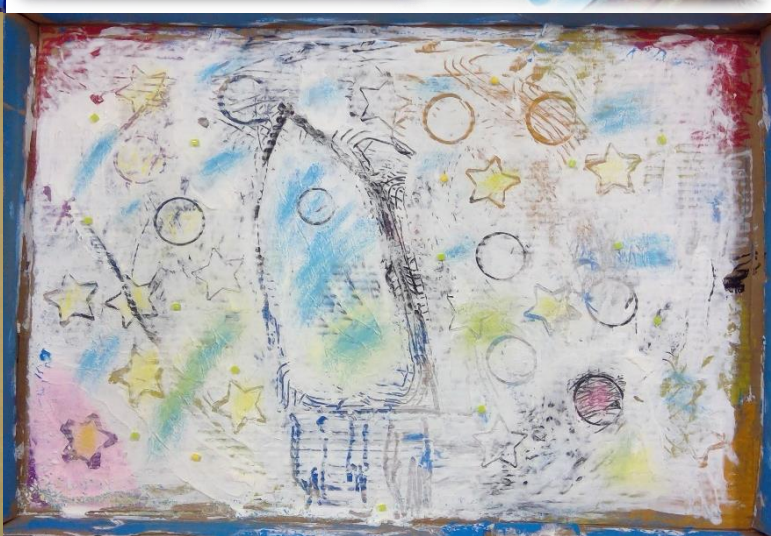
長谷戸小学校 児童たちの作品