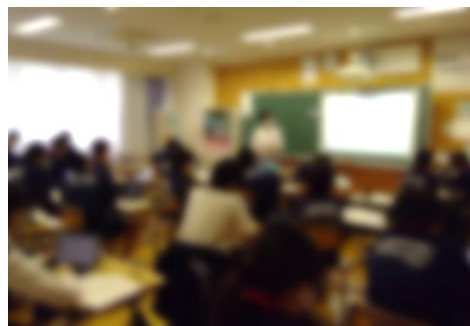
ミライシードを活用した道徳授業