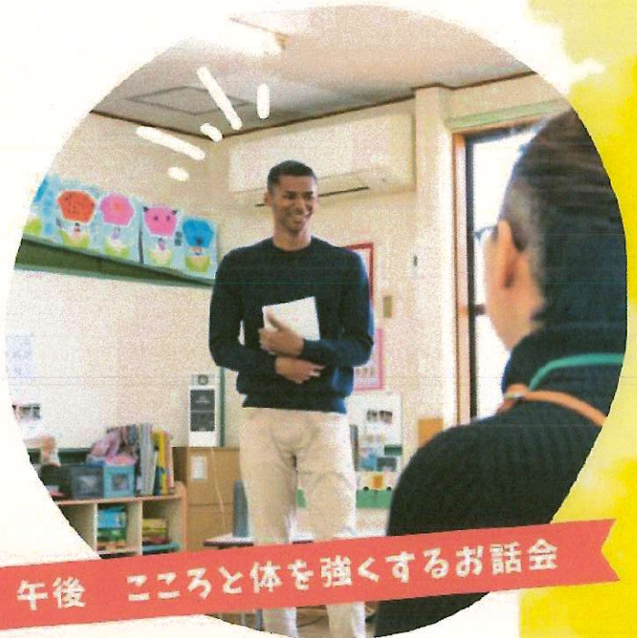
午後 こころと体を強くするお話会