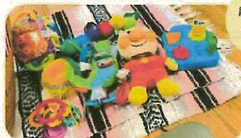
広々とした室内にはおもちゃも充実♪

ママと赤ちゃんで参加できるプチ工作タイム予定しています。 0歳の赤ちゃんも参加できる五感を刺激する知育工作♪ 作った作品はお持ち帰りいただけます♡