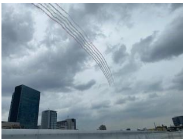
スリーアギストと5本線が描かれました。