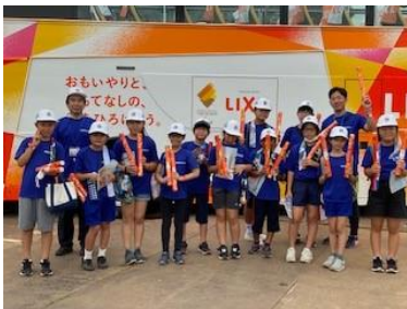
オリンピックより濃い色のトーチでした。

懸念されていたパラリンピック観戦は、何度も変更を受けましたが、実施することができました。特に、子供たちとパラリンピック選手を守るために観戦参加者に、PCR簡易検査を行った際には、限られた日程の中で多くのご家庭に協力していただきました。EOM