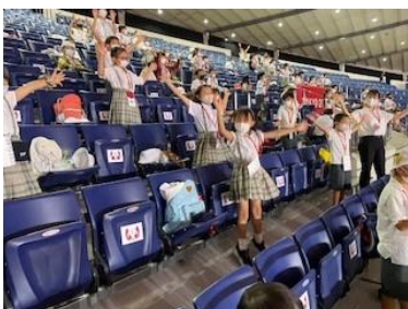
神宮前小の子供たちのパブリカの踊りは、会場の幼稚園・小学校の中で、一番上手でした。

& Schoolの連絡が定着したことと、新たな感染症対策ができたことは、安心・安全な学校運営につながったと思います。