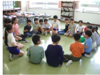
水車班活動:室内ゲーム Indoor games