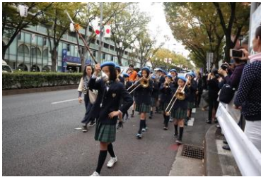
表参道で演奏する鼓笛隊 Marching band playing in Omotesando

There is a Japanese Language class at JES. The Japanese Language Class teaches Japanese and Japanese lifestyles to foreign children and returnees so that they can study with confidence in Japanese schools.