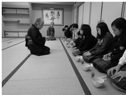
茶道教室(和室) Tea ceremony classroom