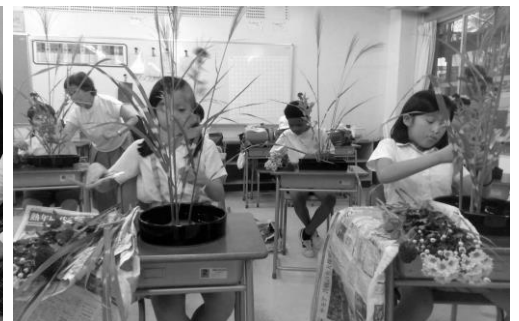
華道教室(算数少人数室) Flower arrangement classroom

季節ごとに俳句づくりを行い、年に4回「神宮前俳句大賞」を実施し、保護者や地域の方にも披露しています。