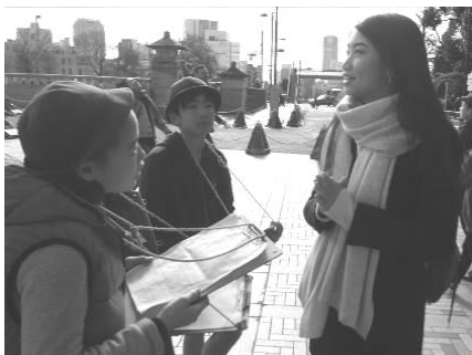
英語でインタビュー(表参道にて) Interview in english

「特色ある教育活動」日本文化クラブ（茶道・華道・お琴）俳句づくり Unique educational activities: Japanese Culture Class & HAIKU