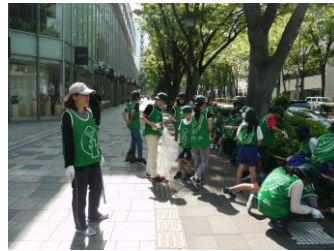
PPK*表参道清掃活動 Omotesando cleaning activities