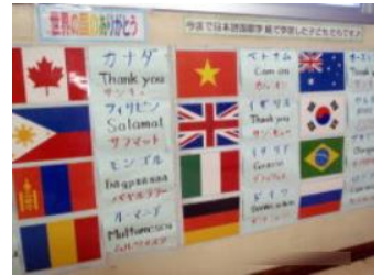
日本語学級で学ぶ子の国旗 National flag of children learning in Japanese class